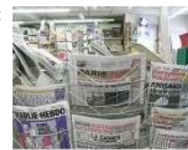
FONDS PRESSE TABAC JEUX