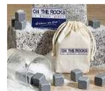
12 GLAÇONS DE GRANIT

CRISE ? REGARDEZ CE QUE VOUS FAITES DE VOTRE ARGENT. ACHETEZ LOCALEMENT ! PRODUISEZ LOCALEMENT !