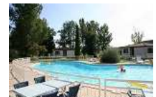
MURS / FONDS ENSEMBLE TOURISTIQUE

CRISE ? REGARDEZ CE QUE VOUS FAITES DE VOTRE ARGENT. ACHETEZ LOCALEMENT ! PRODUISEZ LOCALEMENT !