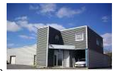
ATELIER AGRO ALIMENTAIRE 450 M²