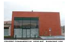
CENTRE COMMERCIAL 1500 M² - PARKING 100