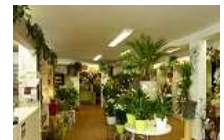
FONDS PLANTES FLEURS BON CA

UTILISEZ NOUS, REJOIGNEZ NOUS.. Vous recherchez une production ? une entreprise ? un service ? Tel : 06.50.69.50.19 vivreaupays@yahoo.fr