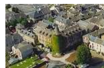
ANCIEN CHATEAU A RENOVER