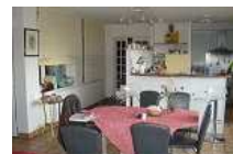
MURS FONDS HOTEL 20CH