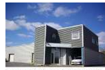
ATELIER AGRO ALIMENTAIRE 450 M²