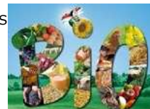
FONDS PRODUITS BIO A REPENDRE. FORT CA