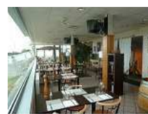
Fonds beau restaurant en 82

CRISE ? REGARDEZ CE QUE VOUS FAITES DE VOTRE ARGENT. ACHETEZ LOCALEMENT ! PRODUISEZ LOCALEMENT !