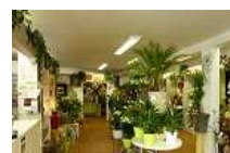
FONDS PLANTES FLEURS BON CA