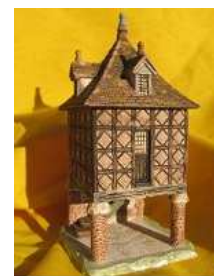
MINIATURE DE PIGEONNIER