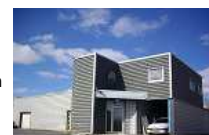
ATELIER AGRO ALIMENTAIRE 450 M 2

CRISE ? REGARDEZ CE QUE VOUS FAITES DE VOTRE ARGENT. ACHETEZ LOCALEMENT ! PRODUISEZ LOCALEMENT !