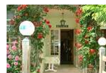
Murs et fonds -Hôtel Restau 18ch