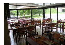
MURS/FONDS HOTEL 14CH RESTAU

NOUS RECHERCHONS POUR NOTRE CLIENTELE DES ENTREPRISES, DES ACTIVITES, DES COMMERCES A REPENDRE APPELEZ NOUS ! Tel : 06.50.69.50.19 vivreaupays@yahoo.fr