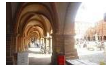
FONDS RESTAURANT CENTRE VILLE MONTAUBAN