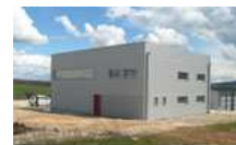
A VENDRE NEUF PRES RODEZ