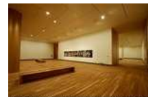
FONDS FABRICATION DE PARQUETS

CRISE ? REGARDEZ CE QUE VOUS FAITES DE VOTRE ARGENT. ACHETEZ LOCALEMENT ! PRODUISEZ LOCALEMENT !