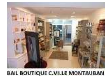
BAIL BOUTIQUE C.VILLE MONTAUBAN