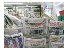
FONDS PRESSE TABAC JEUX

Du 10 au 31 décembre jouez avec Office de l'Artisanat et du Commerce de Montauban Pour NOËL Gagnez 4000€ de chèques cadeaux *