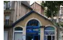
BAIL 300 m² RODEZ 2 NVX