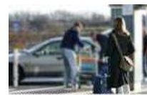
FONDS TAXI TRANSPORT DE MALADES ASSIS ET SCOLAIRES