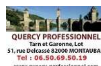
QUERCY PROFESSIONNEL Tarn et Garonne, Lot 51, rue Delcassé 82000 MONTAUBAN Tel : 06.50.69.50.19 www.quercy-professionnel.com