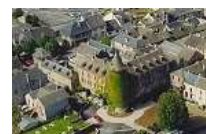
ANCIEN CHATEAU A RENOVER